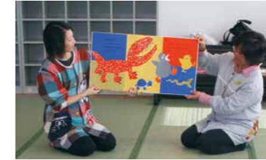
▲ニコニコ一むで大型絵本の読み聞かせをしている様子