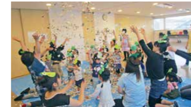
▲サンサン一むで紙吹雪遊びをする参加者の皆さん