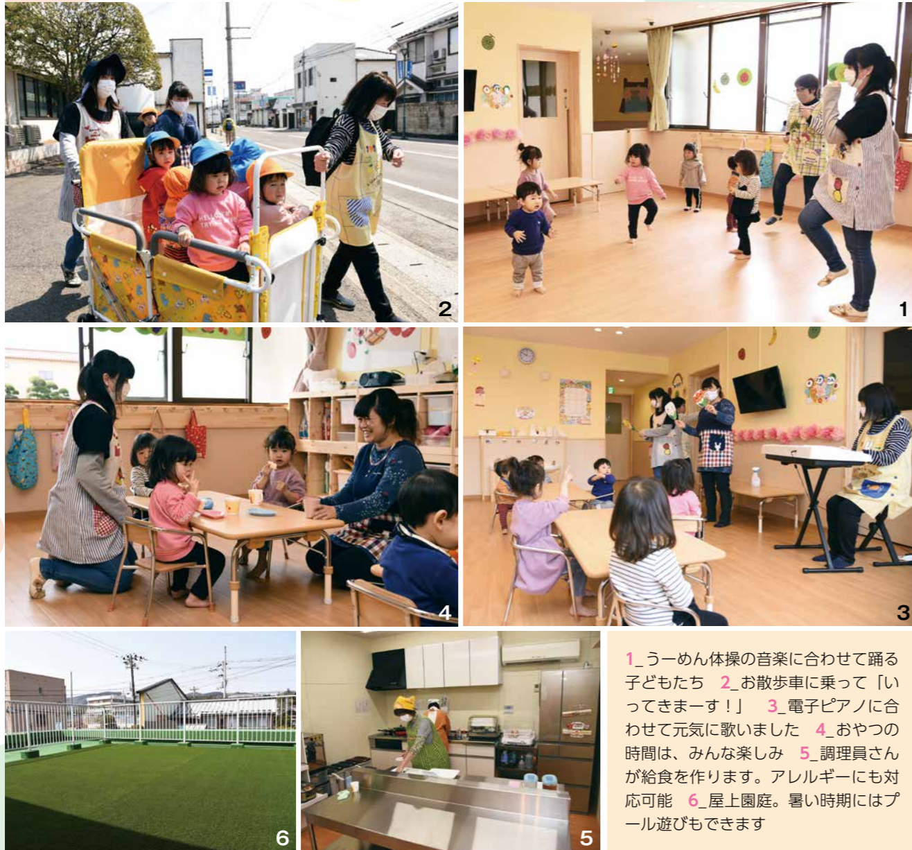
1_うーめん体操の音楽に合わせて踊る子どもたち 2_お散歩車に乗って「いってきまーす！」 3_電子ピアノに合わせて元気に歌いました 4_おやつ時間は、みんな楽しみ 5_調理員さんが給食を作ります。アレルギーにも対応可能 6_屋上園庭。暑い時期にはプール遊びもできます