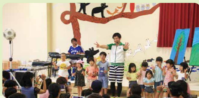
▲2019年、あそびうたコンサートの様子