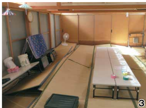
1_JR白石蔵王駅前の大規模な冠水被害 2_台風が去り、水が引いて泥で覆われた鷹巣地区 3_鷹巣集会所は床上浸水被害を受けました 4_2,200トン以上の災害ゴミが発生し、旧白川中学校校庭に仮置き場が設けられました