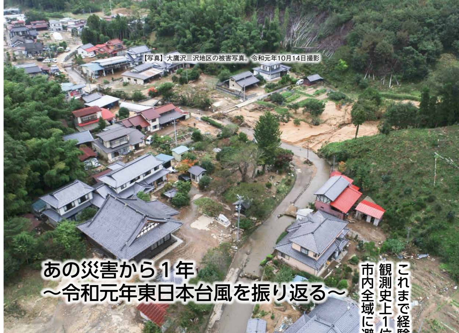
【写真】大鷹沢三沢地区の被害写真。令和元年10月14日撮影