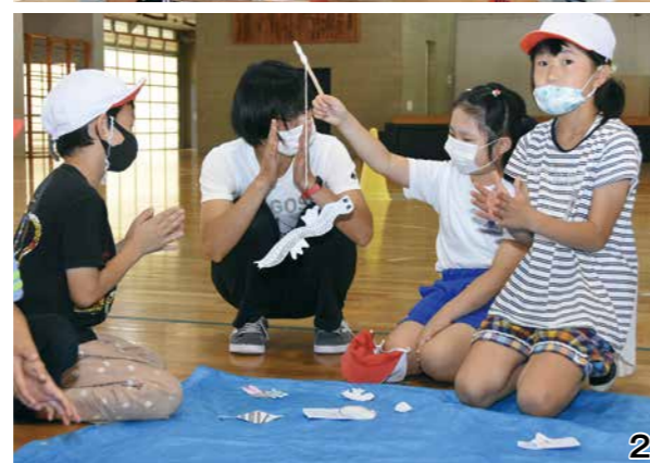
1_ゲームをしながらの楽しく交流 2_釣りざおも魚もすべて手作り、釣った魚は持ち帰ってもらいました