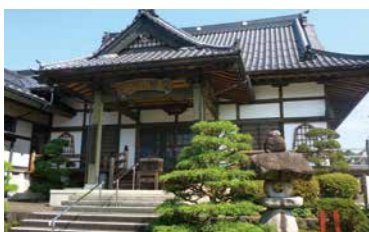
▲第二十一番 瑞祥寺

新西国霊場刈田三十三札所をご存じですか？ 遠方にお参りに行くことが難しい方も、地元で巡拝することができます。御詠歌、御朱印って何？巡拝の心得は？