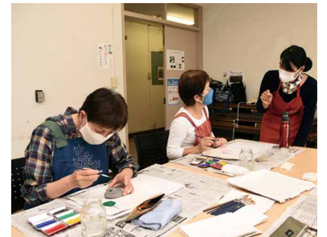
▲6色の絵の具を組み合わせるイメージを形に

参加者は「石を見ていたらいろいろな発想が湧いてきて、とても楽しく描けました」と話していました。