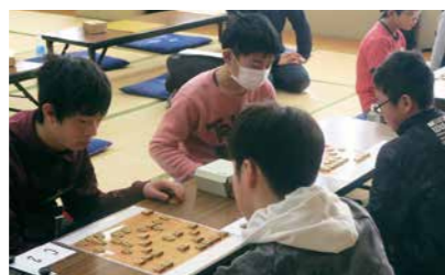
▲対局に集中する参加者