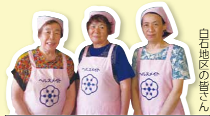
白石地区の皆さん