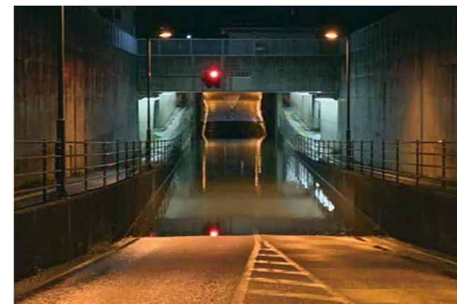
▲冠水した国道113号白石トンネルのアンダーパス

昨年の令和元年10月12～13日にかけて東北地方を通過した台風第19号（令和元年東日本台風）は、宮城県に気象庁より初めての大雨特別警報が発表され、市内全域に甚大な被害をもたらしました。本市では24時間降水量が観測史上1位（365ミリ）を更新するとともに、市内全域に避難指示を発令しました。国道113号の大規模な土砂崩れや大鷹沢三沢地区の決壊したため池などの被害の他に、市が管理する道路・河川の被害が36カ所、農業用施設被害が32カ所、農地被害が86カ所におよびました。その他、国や県の管轄する県道や河川などでも多くの被害が発生しました。