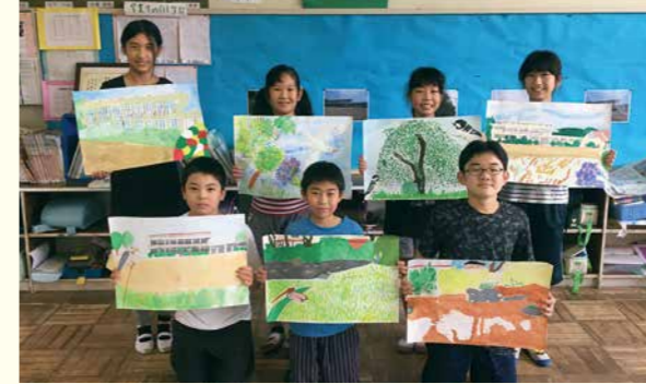
深谷小学校6年生の皆さん