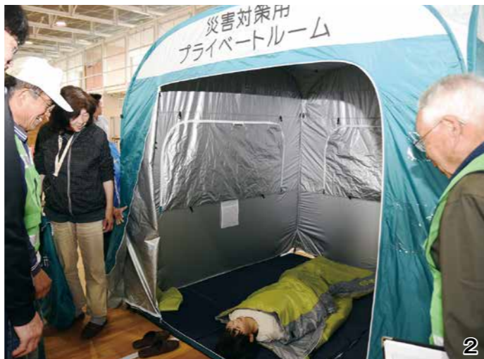
1_姉妹都市からはたくさんの支援を頂きました 2・3_防災の取り組みとして各地区では防災訓練や自主防災研修を実施しています 4_非常用持ち出し袋など事前に災害に備えた準備をしておきましょう