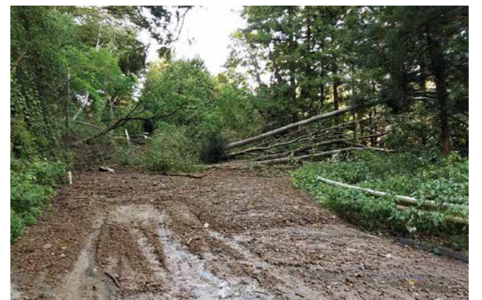
▲国道113号福岡蔵本付近の土砂崩れにより通行止めが発生