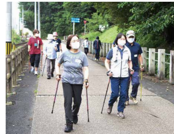
▲ポールを手にウオーキングする参加者

9月14日、運動不足の解消や生活習慣病の予防に役立つノルディックウオーキング教室を開催しました。ポールを手に歩くノルディックウオーキングは、通常のウオーキングと比べて体の負担が少なく、全身運動による高い効果が期待されています。この日は10人が参加し、座学やストレッチの後、ポールを手に白石城周辺の堀沿いや坂道を歩きました。参加者は「楽しく歩けました、機会があればまたやってみたいです」と話してくれました。