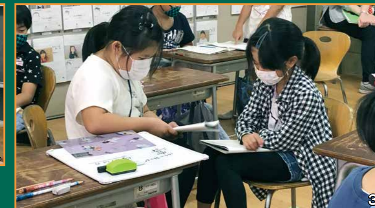
3 ノートを見合いながら考えを説明し合います 4 テープ図を使い問題の解き方を話し合いました