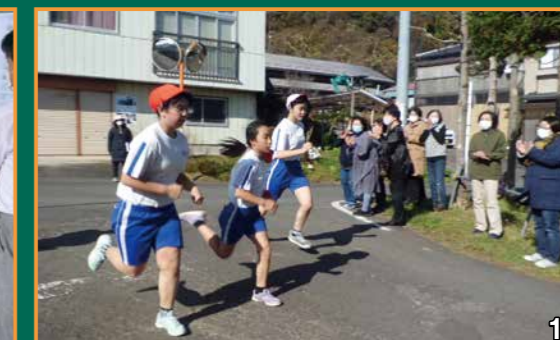
1 2kmを走り、最後の坂道でラストスパート! 2 自分の考えを一人一人が発表しています