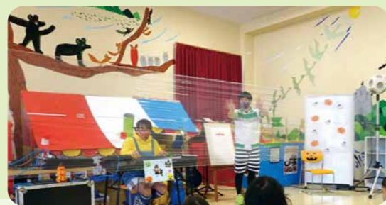
▲10月の親子で楽しむシアター・シアター