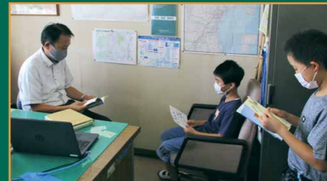
▲校長室で暗唱名人の最終関門をチャレンジする児童の様子

三つ目は、「白石市暗唱読本『夢』」を児童が暗唱する取組を行っており、「目指せ!暗唱名人」のカードを使って、児童が一生懸命に暗唱にチャレンジしています。暗唱を通して主体的に学ぼうとする児童が多く見られるようになっています。