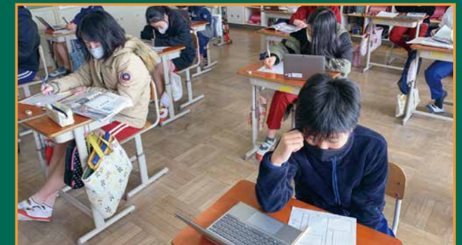
▲授業の中で積極的にタブレット端末を使って学習しています