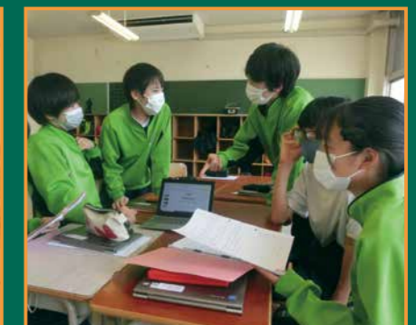
▲どう工夫したら伝わるかを事前に話し合いました