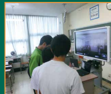
▲現地の生徒たちの反応を見ながら発表します

発表する活動では、オーストラリアの生徒たちにイメージを持ってもらうために、英語による紹介に加え、タブレットを使って画像も見てもらいました。後半の質問タイムでは、お互いに興味のあることについて英語と日本語で活発に意見を交換しました。お互いが話す言葉を一生懸命聞き、伝えようとする姿に、国境を超えた友情が育まれてきたことを感じました。