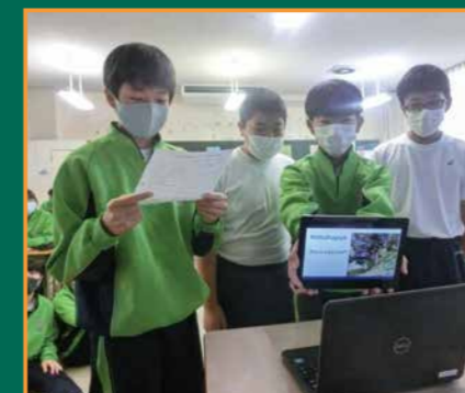
▲スライドを見せながら英語で白石市を紹介しています