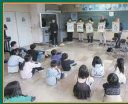
▲白石警察署と連携した防犯教室