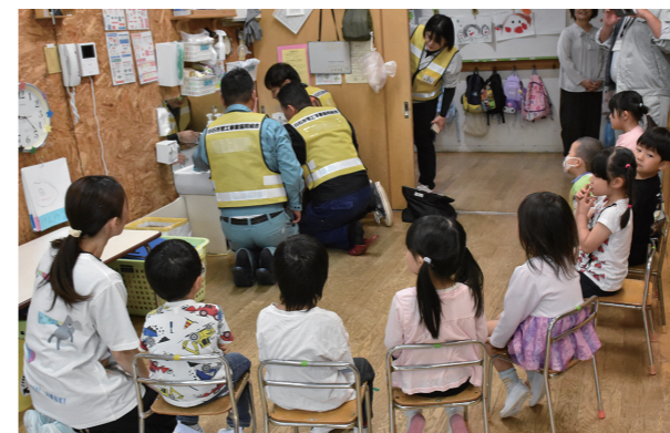
▲点検作業を真剣なまなざしで見つめる園児たち

5月26日、白石はるかぜこども園で人権擁護委員による人権教室と「人権の花運動」が行われました。この活動は、花を植えて育てることを通して、生命の大切さを学び、優しさや思いやりの心を育むことを目的に、市内の保育施設などで実施。当日は人権キャラクターと一緒に参加し、園児たちは楽しみながら花苗を植え付けました。