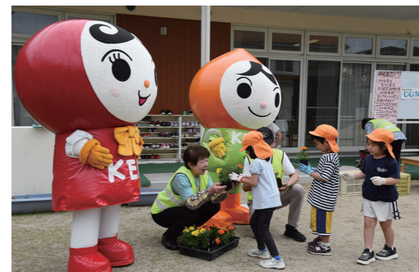
▲人権キャラクターと人権擁護委員から花苗を受け取る園児たち