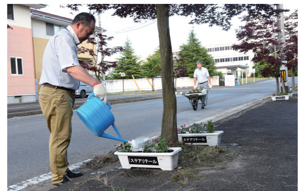
▲従業員が植えた花々が工場前の道路を彩りました

5月24日、中央公民館で「第49回白石市こどもまつり」が行われました。市内の子どもたちが多数参加し、ペットボトルボウリングなどの体験コーナー、丸太切りした木でネックレスを作る工作コーナーなどを楽しみました。会場には笑顔と元気な声があふれ、子どもたちは思い思いにイベントを満喫していました。