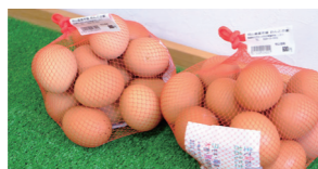
新鮮な卵はおすすめ！▶