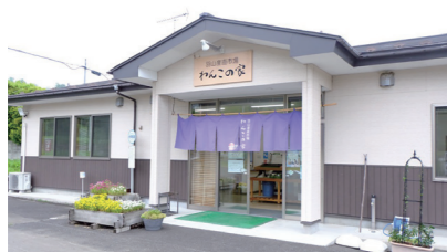
◀地域名から名付けられた「わんこの家」