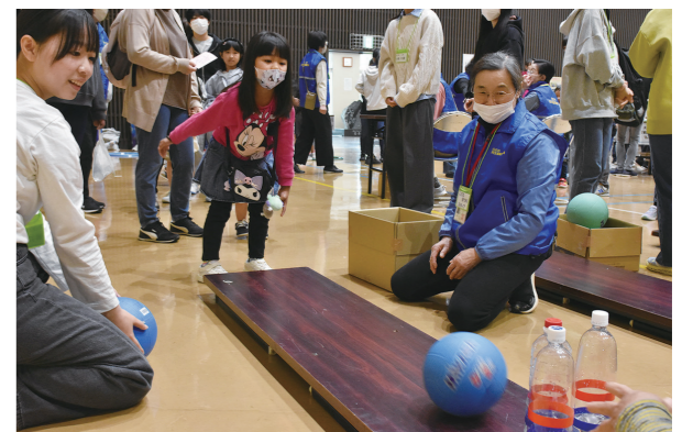
▲ペットボトルボウリング何本倒せるかな？

6月3日、南保育園をはじめとする市内公立保育園・幼稚園3園で水道点検が行われました。この活動は、6月1日から7日までの「水道週間」に合わせて市内の水道業者で構成される白石市管工事業協同組合が実施。園児は「水を守るヒーローみたいでかっこいい。これからも水を大切に使いしていきたい」と話していました。