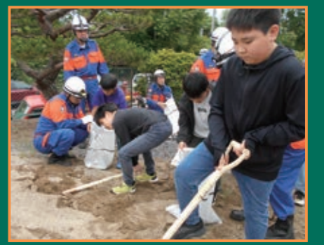
▲越河公民館での体験訓練