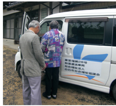
◎白石市社会福祉協議会 ☎22-5210