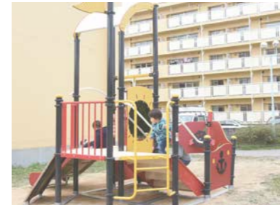
▲子育て応援住宅敷地内に設置された遊具で元気に遊ぶ子どもたち