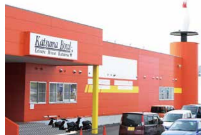
▲ボウリング講座の会場となるカツマボウル