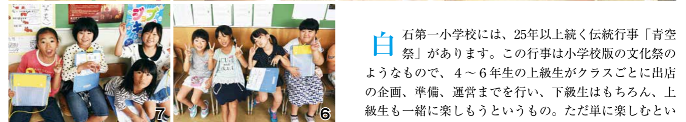
1・2_おばけ屋敷の準備をする6年生 3・4_みんなでスライムづくり。のびるスライムは新触感! 5_体育館での障害物競走 6・7_ゆくゆくはみんなを楽しませるお兄さん・お姉さんに!